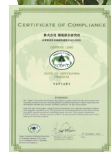
ECOFIT認定書 (ツルグミエキス)