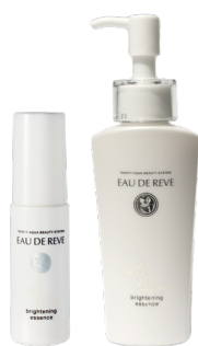
＜オードゥーリーベ＞ スキンケアローション 35mL ¥5,500 (税込) 120mL ¥13,200 (税込)

4種類のプライトニング保湿成分と浸透*滞在型WビタミンC誘導体を新たに配合。保湿成分が乾燥を防ぎ、明るく透明感のあるお肌へ導きます。石油系界面活性剤フリー、エタノールフリーなど全9種類のフリー処方でお肌をやさしい美容液です。