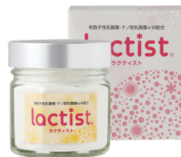
ラクティスト <乳酸菌含有食品> 120g 16,200円(税込)

注2) 粉舞いによる誤嚥の心配がある場合、できるだけ牛乳やヨーグルト、スムージーなどに混ぜてお飲みください。